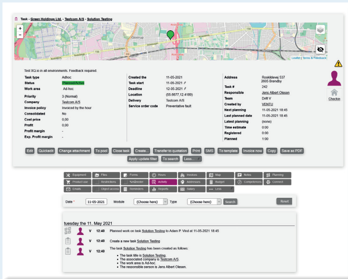
Titelseite einer Aufgabe in der Webanwendung